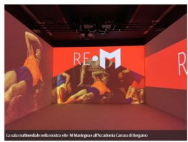
La sala multimediale nella mostra «Re-M Mantegna» all'Accademia Carrara di Bergamo

Si apre il 24 aprile a Bergamo, all'Accademia Carrara di Bergamo (fino al 21 luglio), la mostra Re-M Mantegna , curata da Antonio Mazzotta e Giovanni Valagnano. Una mostra che ha il sapore del mistero: sedici opere (divise per 10 sale più il salone, appena restaurato, della Barchessa) che ruotano attorno al fulcro del grande maestro rinascimentale Andrea Mantegna (1430/31 - 1506). E in particolare a quella sua Resurrezione dipinta a tempera e oro datata 1492, una Resurrezione che era rimasta confinata nei depositi dell'Accademia Carrara fino al maggio 2018, quando era stata definitivamente attribuita a Mantegna, grazie all'italiano di Giovanni Valagnano, che l'aveva individuata come «ideale continuazione» della Discesa di Cristo al limbo , opera anch'essa di Mantegna sempre datata 1492, battuta all'asta da Sotheby's nel 2002 per 28 milioni di dollari, già nella collezione di Barbara Plasecka Johnson.